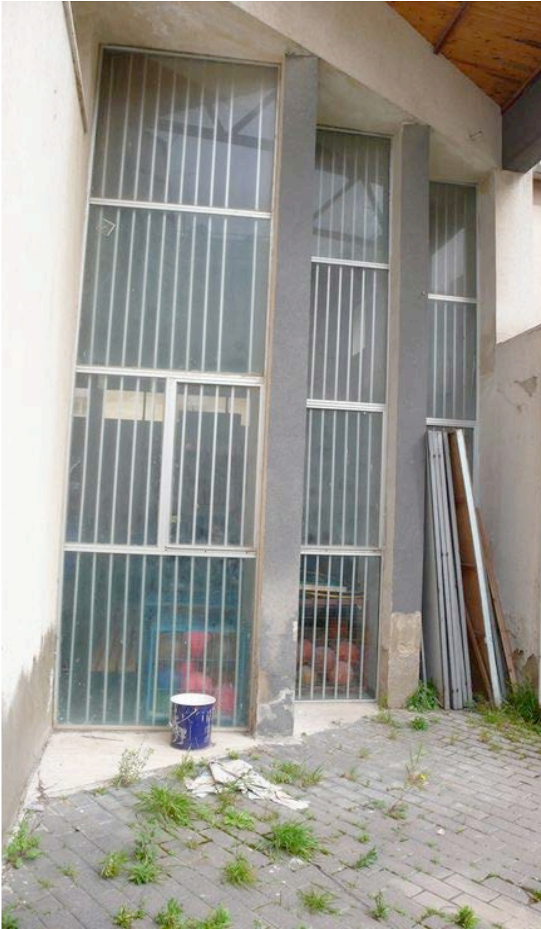
Infissi esterni palestra